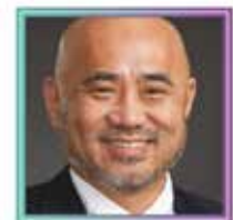
Thay Lee Palestrante confirmado